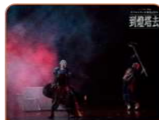
2020年度製作 《到燈塔去》