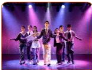
2022年度製作 原創音樂劇《來自山中的聲音》