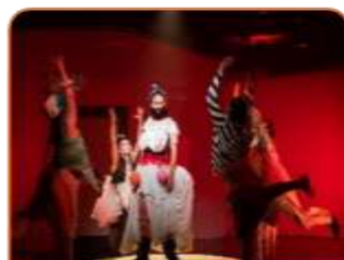
2021年度製作 《不男不女到彼岸》