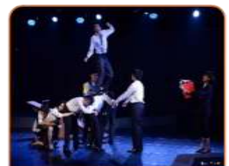
2019年度製作 《安蒂岡妮不勇敢》