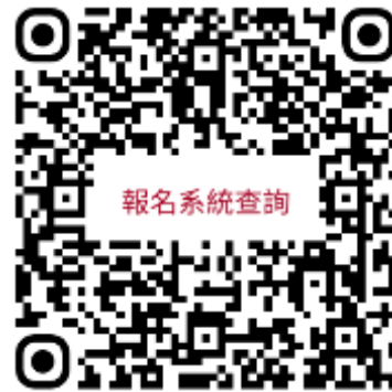
本校報名系統查詢頁面