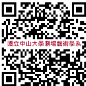
劇場藝術學系官網