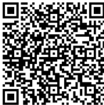
2 分鐘上山路線短影